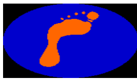
Les Marches Européennes